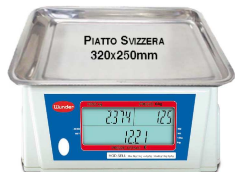
SELL: VISTA POSTERIORE