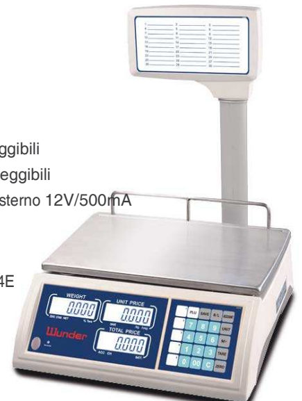
PIXP: VERSIONE A BANDIERA