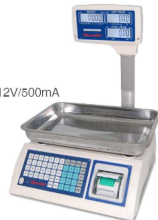
JPP CON PIATTO "FRUTTA"