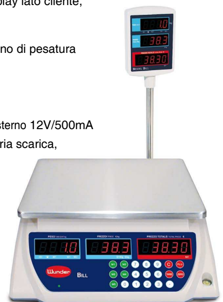
BILL-P: VERSIONE A BANDIERA