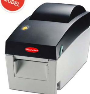
EZ2DT etichettatrice (Vedi/See page70)