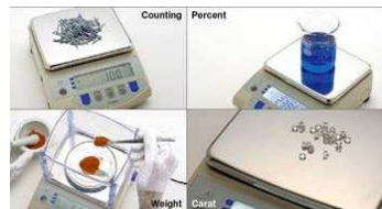
AJH: PRECISIONE PER VARIE FUNZIONI