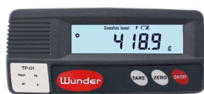
NHB: VISORE REMOTO