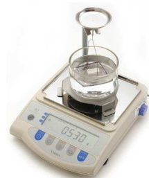
AJH: KIT PESO SPECIFICO